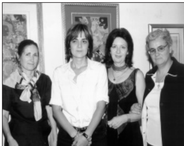
Από την έκθεση ζωγραφικής στη ΧΑΝΘ