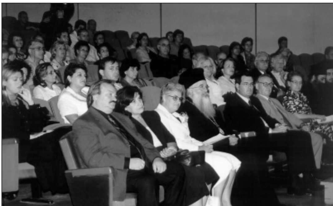
Από την εκδήλωση στη Παγκόσμια Ημέρα για τη Νόσο Alzheimer

Η μαγνητική τομογραφία παίζει πλέον κριτικό ρόλο στη διάγνωση, την παρακολούθηση και κατ' επέκταση στην πρόγνωση των ασθενών με διαταραχές μνήμης και άνοια. Η προσπάθεια των νευροακτινολόγων σήμερα είναι να βοηθήσουν όσο μπορούν περισσότερο στη διάγνωση, την διερεύνηση και παρακολούθηση των πασχόντων.