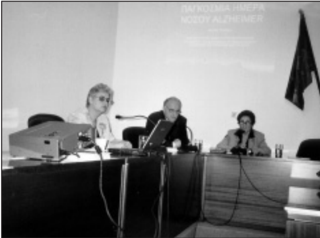
Από την εκδήλωση στον Πολύγυρο

Στην αίθουσα συνεδριάσεων του Δήμου Πολυγύρου την Κυριακή 9 Νοεμβρίου 2003 και ώρα 11.00 π.μ. πραγματοποιήθηκε εκδήλωση με την υποστήριξη των φορέων: