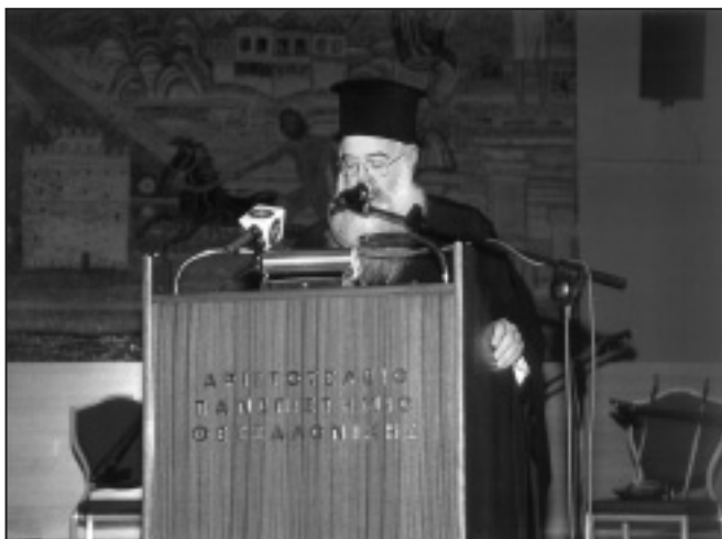
Από την εκδήλωση στη Παγκόσμια Ημέρα για τη Νόσο Alzheimer

Εάν λοιπόν αντιλαμβάνεται κανείς ή ο ίδιος ή οι συγγενείς του ότι έχει προβλήματα μνήμης ας επισκεφτούν ένα γιατρό. Ας πάρει μαζί του όλα τα φάρμακα και τις εξετάσεις που έχει κάνει καθώς επίσης ας γράψει ο ίδιος ή ο πλησιέστερος συγγενής του όλα τα ιατρικά προβλήματα που είχε στο παρελθόν ή παρουσιάζει τώρα. Όλες οι αλλαγές της συμπεριφοράς, όλων των συμπτωμάτων, της υγείας του ασθενούς αλλά και του περιθάλποντος είναι θέματα που πρέπει να συζητηθούν με το γιατρό σας. Κατά τη διάρκεια της εξέτασης ο ασθενής πρέπει να προσπαθεί να αποδώσει όσο καλύτερα μπορεί και ο συγγενής του να γράψει όλα τα συμπτώματα καθώς επίσης να σημειώσει πότε άρχισαν. Καλά είναι να ξέρετε το οικογενειακό σας ιστορικό. Ρωτήστε το γιατρό σας γιατί γίνονται όλες αυτές οι ερωτήσεις και πότε μπορεί να σας μιλήσει για τη διάγνωση. Θα πρέπει να έχουμε πάντα στο μυαλό μας ότι δεν υπάρχει μία απλή εξέταση, ένα απλό test που θα μπορούσε να θέσει τη διάγνωση. Συνήθως η διάγνωση τίθεται, όταν ο γιατρός επικοινωνήσει με τον ασθενή, με τον συγγενή που μένει μαζί με τον ασθενή και ελέγξει τα φάρμακα που παίρνει ο ασθενής, διότι υπάρχουν φάρμακα που προκαλούν διαταραχές μνήμης. Από την εξέταση